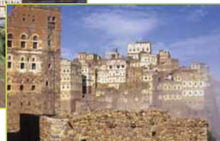
▲ Magnifique architecture des maisons de la capitale du Yémen, Sanaa.

C'est le long de cette côte que se trouve le port de Moka, plus grand exportateur mondial de café pendant des siècles puis tombé en déclin quand la culture du café s'est étendue à d'autres contrées. Celle-ci a été récemment remplacée par la culture du Qat, feuillage vert aux effets légèrement euphorisants, que mastiquent les hommes en début d'après-midi après avoir passé la