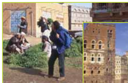
▲ Palabres qui précèdent l'achat de feuilles de Qat.

Rimbaud qui y séjourna vers 1880 dira de ce port, coincé entre la mer et la falaise, que ce sont " Les portes de l'enfer ". On peut encore voir sa maison ainsi que les citernes qui alimentaient la ville en eau douce.