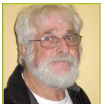
Par Jean-Guy Thibaudeau