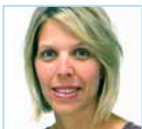
Par Nathalie Charbonneau Directrice de la DTR

L'Évaluation des technologies et des modes d'intervention en santé (ETMIS) est la 4 ième mission de l'Institut universitaire. Elle complète donc les activités de soins et services offerts, d'enseignement et de recherche.