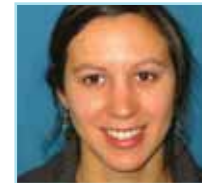
Par Raphaëlle Lebrun Conseillère en développement organisationnel

Le 11 avril dernier, l'IRGLM a soumis sa candidature au Ministre de la santé et des services sociaux en vue d'obtenir une mention d'excellence pour ses pratiques novatrices de mobilisation et de valorisation du personnel.